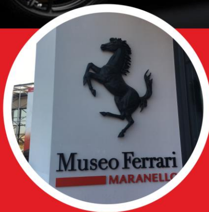
Wizyta w Muzeum Ferrari w Maranello