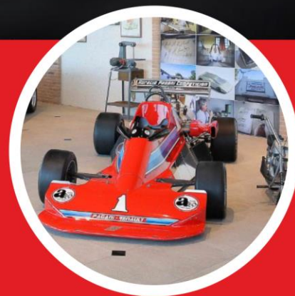
Zwiedzanie Fabryki i Muzeum Pagani